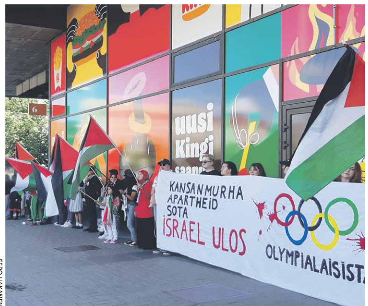
6.7. Loppu kansanmurhalle -ihmisketju Helsingissä.