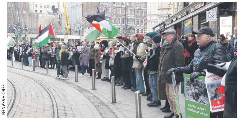
23.3. Seiso Gazan puolella - ihmisketju kansanmurhaa vastaan. Helsinki.