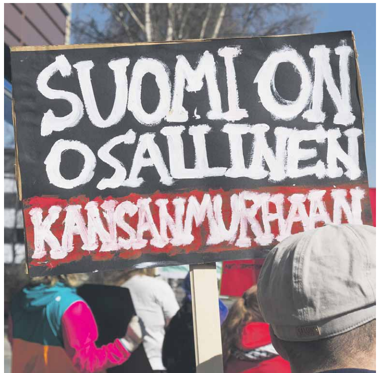
18.5. Palestiina-mielenosoitus, Tornio-Haaparanta.

stitutionalisoitu palestiinalaisvankien pahoinpitelyyn ja kiduttamiseen keskittyvä politiikka. Sen uhriksi voi joutua kuka tahansa palestiinalainen. Vankilapolitiikan keskiössä ovat toistuva ja vakava mielivaltainen väkivalta, johon kuuluvat seksuaalinen väkivalta, nöyryyttäminen ja halventaminen, nälässä ja epähygieenisissä olosuhteissa pitäminen, unen riistäminen, uskonnon harjoittamisen kieltäminen, tavaroiden takavarikointi sekä riittävän terveydenhoidon estäminen. Leirit toimivat de facto kidutuskeskuksina.