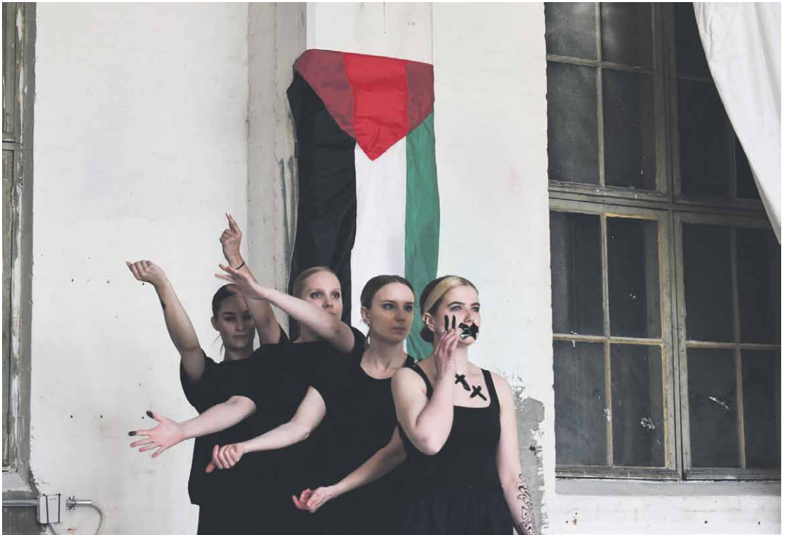
Evening for Palestine 18.3.2024, Kuopio.