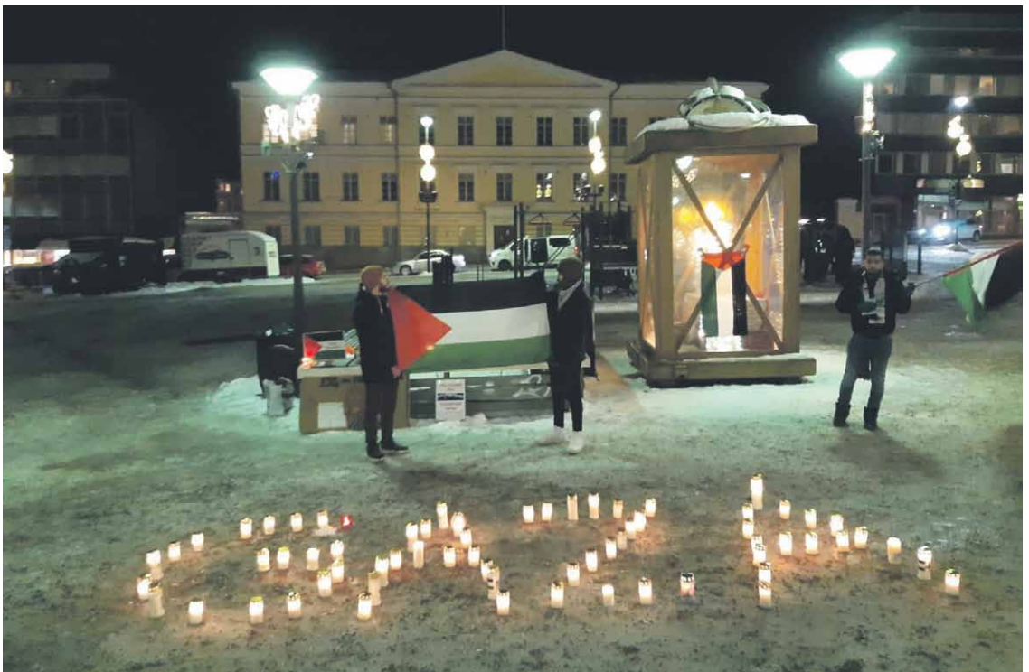
17.12.2023 Kynttilätilaisuus Hämeenlinnan torilla.