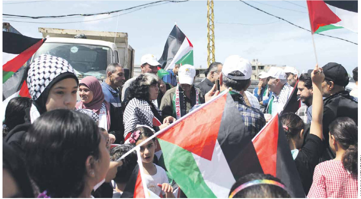
Moni Nahr el-Baredin asukas odottaa edelleen kotia vuonna 2007 tuhoutuneen tilalle. Siitä muistuttamiseksi Nahr el-Baredissa järjestetään mielenosoitus joka toukokuussa.

Taluskriisiin kytkeytyy energiapula. Valtion sähköyhtiö jakelee sähköä ehkä muutaman tunnin vuorokaudessa, satunnaisesti aikoihin. Ihmiset tarvitsisivat sähkösopimuksen myös yksityisestä generaattorisähköstä.