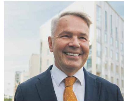
Pekka Haavisto. haavisto2024.fi

Pekka Haavisto (kansalaisliike ja vihr.): - Hamasin hyökkäys 7.10. Israeliin on horjuttanut Lähi-idän haurasta vakautta ja aiheuttanut suurta inhimillistä kärsimystä. Hamasin nujertaminen on Israelille oikeutettu päämäärä. Vastatoimissa on nou-