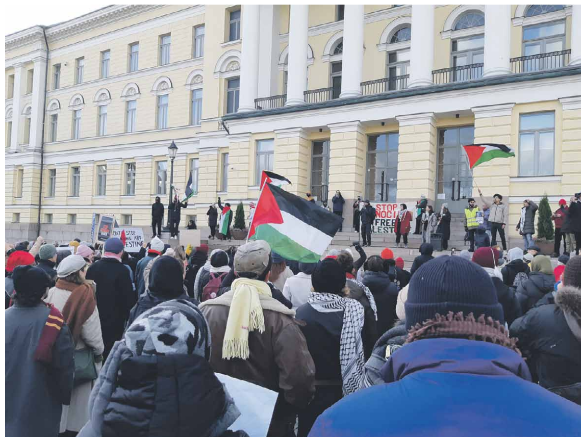
Mielenosoitus Helsingissä 21.10.

Kirjoitus perustuu puheenvuoroon rauhanjärjestöjen mielenosoituksessa Helsingissä 21.10.2023