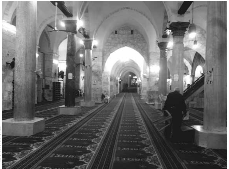
Moskeijoiden rukouksutsuja joudutaan nyt noudattamaan kodeissa. Nablusin moskeija on autio jo ennen täydellistä sulkua.