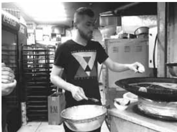
Ruokaa saa valmistaa ulkona myytäväksi, mutta kauppa käy huonosti, sanoo salafelin paistaja Ramallahissa.

Näiden asuntojen omistajat kuuluvat järjestöihin, jotka vastustavat Israelin miehitystä. Heidät on vangittu, muut perheenjäsenet pakotettu muuttamaan muualle ja kodit käyty hajottamassa. Ensimmäinen koti on kerrostalossa. Naapuri