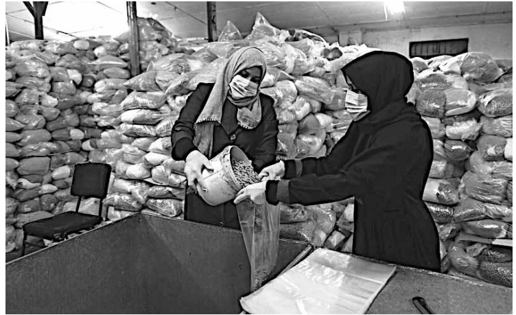
YK:n UNRWA:n työntekijät Deir al-Balahissa Gazan alueella, valmistelevat 31.3. ruoka-annoksia toimitettavaksi palestiinalaispakolaisten perheille estäen näin ihmisten kerääntymisen jakelukeskuksiin ja COVID-19 pubkeamisen tibeään asutulla alueella.

Hyväntekeväiskeräystä ruokapakettien toimittamiseksi perheille olivat tukeneet Israelin puolella asuvat palestiinalaiset.