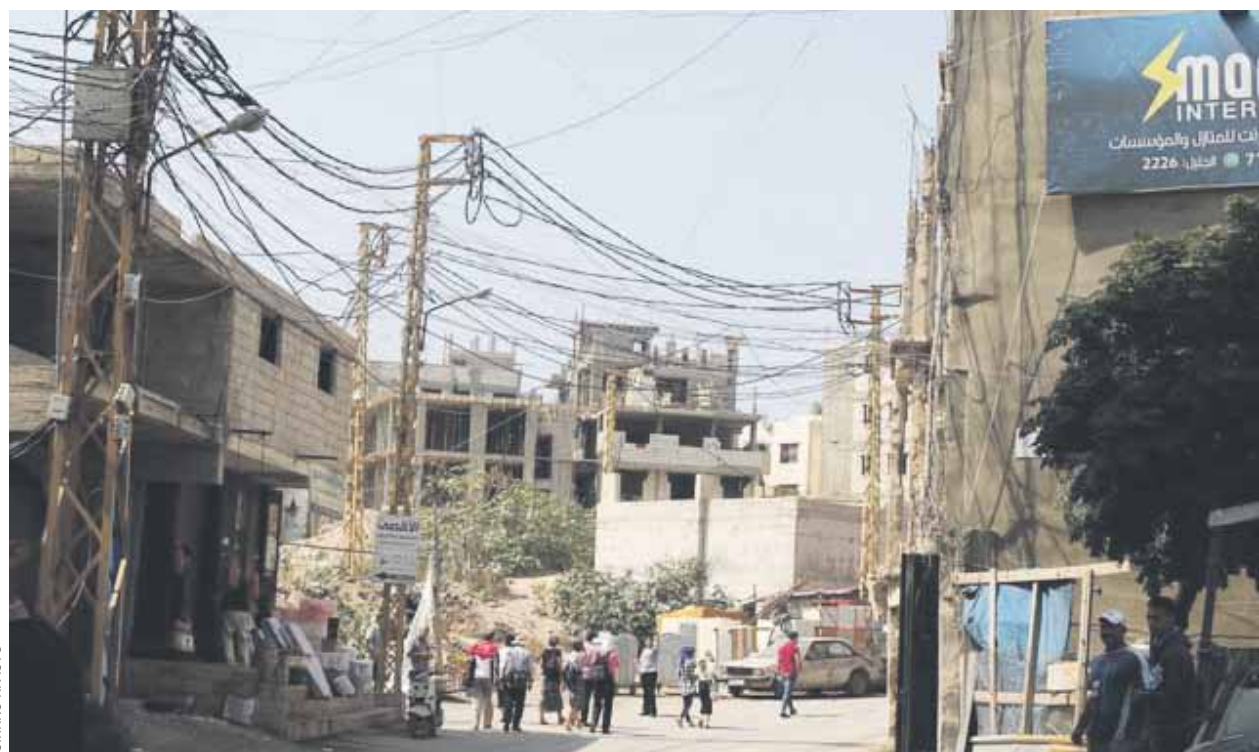
Jälleenrakennus on Nahr el-Baredissa yhä kesken.