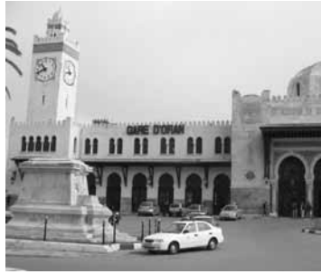
Mitä kello käy Algeriassa? Oranin Rautatieasema on ainakin upea.

1) Bretton Woods -järjestelmä sai alkunsa vuonna 1944, kun toisen maailmansodan voittajavaltiot kokoontuivat Yhdysvaltoihin Bretton Woodsin kylään sopimaan sodan jälkeisistä kansainvälisten talouden pelisäännöistä. Neuvottelujen tuloksena syntyi Kansainvälinen valuuttarahasto IMF sekä kansainvälinen jälleerakennus- ja kehityspankki IBRD, josta kehittyi myöhemmin nykyinen Maailmanpankki . Nämä järjestöt muodostavat niin sanotun Bretton Woods -järjestelmän perustan.