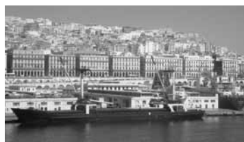
Algerin kaupungin ranta.

Vähitellen he onnistuivat perustamaan poliittisia liikkeitä. Reformistinen suuntaus kehkeytyi ranskalaiseen elämäntapaan sopeutuneesta eliitistä. Sitä edustivat nuoralgerialainen liike ja uskonnollisempi ulamaa-liike. Radikaalimpaa suuntausta edustivat kom-