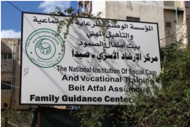
Saidan perheneuvolan katukyltti. SK

71 % vanhemmista ilmaisi suurta tyytyväisyyttä perheneuvolaan, 29 % jossain määrin