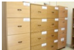
Beirutin perheneuvolan arkistolaatikosto SK

information about family: house size, social status of the parents, social conditions for the family