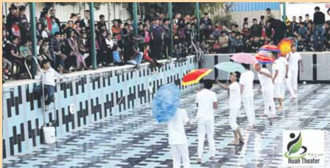
Kuva otettu Al Aroubin pakolaiskylän hylättyyn uima-altaaseen sijoittuneesta esityksestä The Faces of The Pool . Esityksen ohjaus: Helena Korpela ja Annukka Valo.

MA-opiskelija, teatteriopettajan maisteriohjelma Taideyliopiston Teatterikorkeakoulu