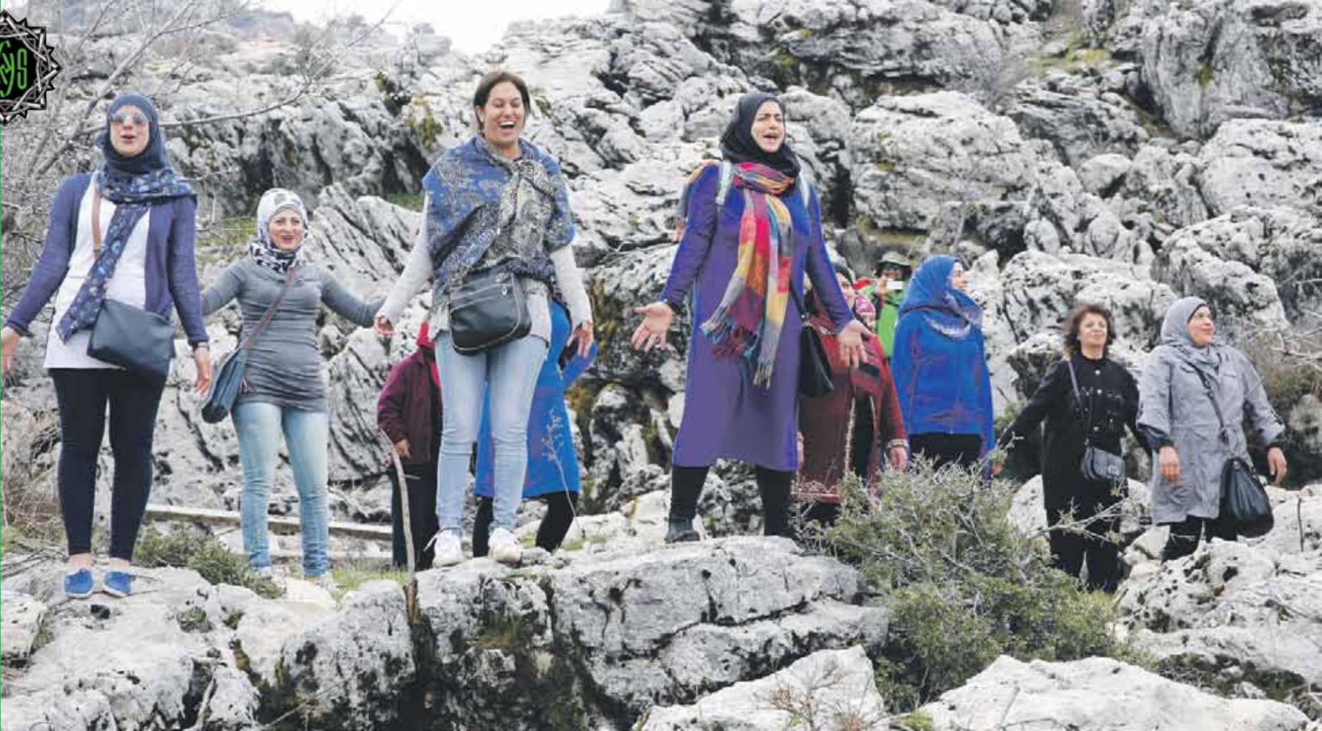
Stressihuuto auttaa purkamaan jännitystä ja levottomuutta.