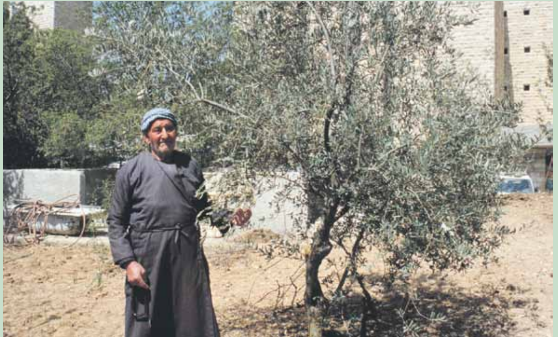
Oliivipuun kasvu hitaasti, valloittajan talo nopeasti. Palestiinalaisen viljelijän koti ja maa, jotka olivat jäämässä kokonaan israelilaisen yliopiston asuntolan alle. kuva vuodelta 1999.

Paikalle pääsee helposti kaikilla lähijunilla, raitiovaunuilla 7A, 7B ja 9 sekä monilla busseilla..