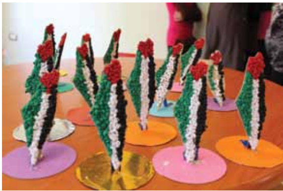
Lasten askartelemat Palestiinaliput.

YK:n kv. Palestiina- solidaarisuuspäivänä perjantaina 29.11.2013 klo 17