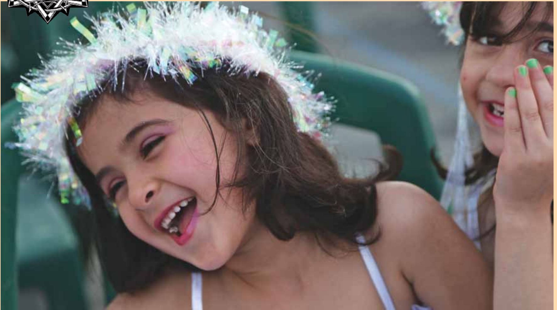
Ankarista elinoloista huolimatta gazalaisessa lastenjuhlassa on iloa ja loistoa.