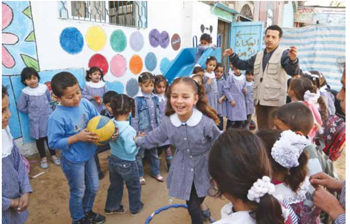
Lapset leikkivät Youth Empowerment Centerin pihassa Jabalian pakolaisleirissä.

Lapset tutkitaan, kun he tulevat järjestön ohjelman piiriin. Heidät myös valokuvataan. Ohjelma saattaa pelastaa joidenkin lasten hengen. Khan Youninin keskuksessa henkilökunta näytti vaikeimman hoitotapauksensa asiakirjoja. Tulovalokuva toi mieleen kuvat Biafran nälkäänäkevistä lapsista 1960-luvulta. Kahdeksan kuukauden hankejakson jälkeen pienokainen näytti tavalliselta pikkulapselta.