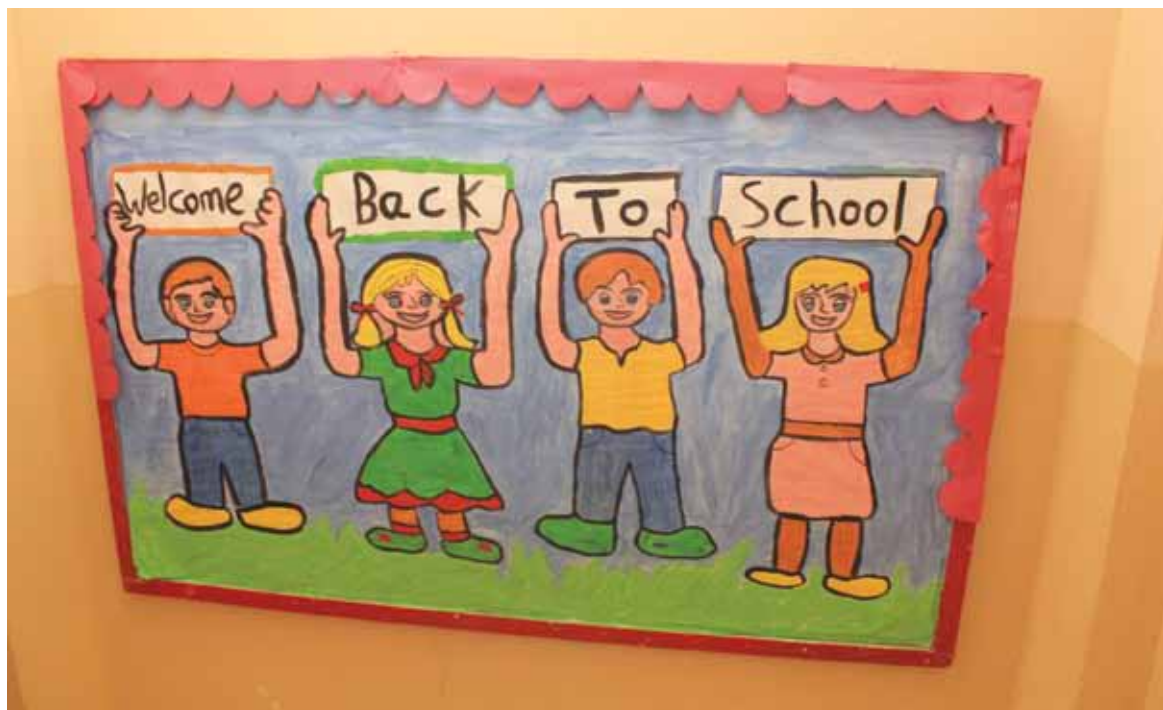
Tervetuloitovotus koululaisten tukiopetustunneille Beirutissa.