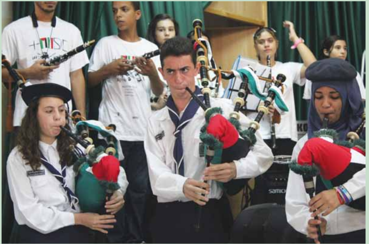
Säkkipillit soimaan murheenkin keskellä! Bourj el-Shemali 20.9.2013.

Syyriasta on tulvinut Libanonin pakolaisleireille jo lähes 100 000 pakolaista. Useimmat ovat Palestiinan pakolaisia, jotka pakenevat nyt uudestaan. Kaikki heistä eivät heti rekisteröidy YK-järjestö UNRWA:n avun piiriin. AKYSin ja Psykologien