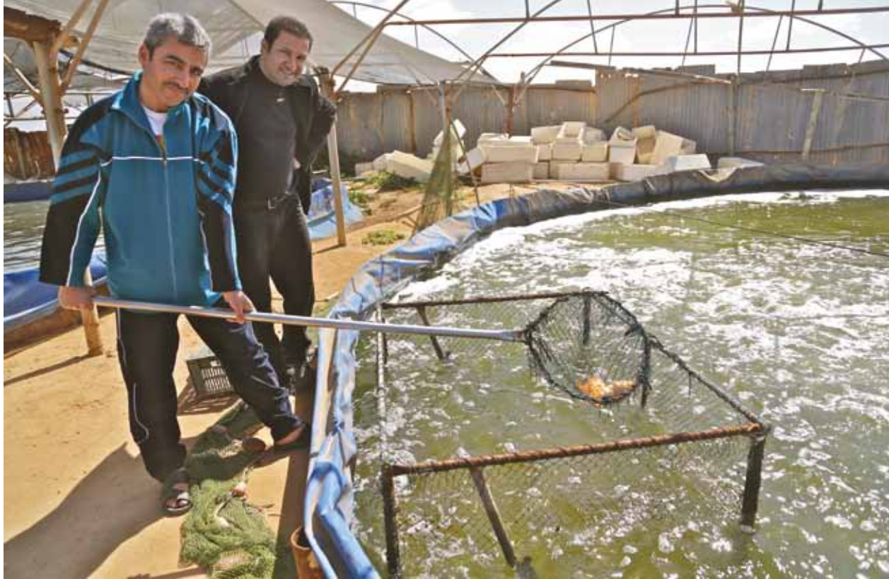
Kalanviljelyllä Gazassa Välimeren rannalla.

UNRWA:n toimipisteissä en vieraillut, mutta pääsin muuten seuraamaan lasten kanssa tehtyä työtä. Olin vieraana suuressa lastenjuhlassa. Pukuloisto ylitti meidän entiset presidentinlinnan juhlamme ja kaikki olivat onnellisia. Olin lasten satutunneilla Qattanin lastenkulttuurikeskuksessa (Qattan Center for the Child) – puitteiltaan niin upea laitos, ettei vastaavaa lasten keskusta Helsin-