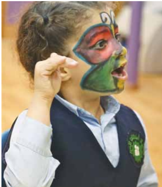
Tyttö opettelee Atfaluna Society for Deaf Children -järjestön päiväkodissa viittomaan sanan kameli.